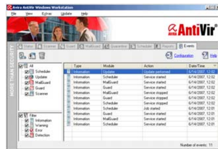
L'interfaccia intuitiva di Avira AntiVir Professional.

In grado di individuare e debellare nuovi potenziali virus ed eventi critici , Avira AntiVir è riconosciuto anche dai più importanti benchmark come l'antivirus più efficiente disponibile sul mercato . E tutto questo grazie alla filosofia seguita dall'engine di Avira AntiVir: massima efficacia, ma senza appesantire il computer .