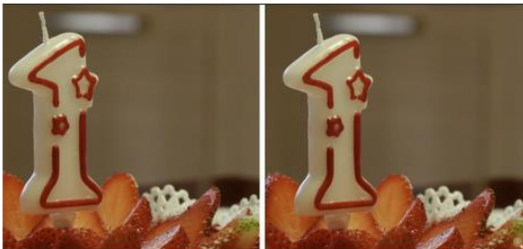
A confronto una fotografia ad alta risoluzione, a sinistra la versione ottimizzata con NXPowerLite for Desktop [clicca per ingrandire]

Lavorando con le immagini i risultati si sono dimostrati particolarmente interessanti. A partire da fotografie JPG da 20 MPixel provenienti da una reflex Canon EOS 70D siamo stati in grado di guadagnare l'81% , passando da 6,5 MByte a poco più di 1,2 MByte. La qualità complessiva e il livello di dettaglio risultano visivamente identici , con minime differenze riscontrabili solo effettuando una comparazione con un elevato fattore di ingrandimento (300% - 400%) . In questo caso, l'algoritmo di gestione di adottato da Neuxpower si dimostra nettamente più efficace del consueto schema adottato dai diffusi software ZIP.