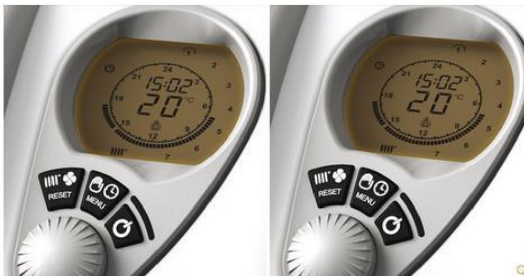
A confronto le immagini contenute in un file PDF, a sinistra la versione ottimizzata con NXPowerLite for Desktop [clicca per ingrandire]

Lavorando con le immagini i risultati si sono dimostrati particolarmente interessanti. A partire da fotografie JPG da 20 MPixel provenienti da una reflex Canon EOS 70D siamo stati in grado di guadagnare l'81% , passando da 6,5 MByte a poco più di 1,2 MByte. La qualità complessiva e il livello di dettaglio risultano visivamente identici , con minime differenze riscontrabili solo effettuando una comparazione con un elevato fattore di ingrandimento (300% - 400%) . In questo caso, l'algoritmo di gestione di adottato da Neuxpower si dimostra nettamente più efficace del consueto schema adottato dai diffusi software ZIP.