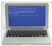
Ripristino con Windows Recovery Environment