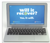
Ripristino con RecoverAssist